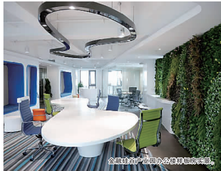
金融硅谷产业园办公楼样板房实景图。

蜂巢创业孵化器——创客中心的引入，有助于圈内优秀双创项目的落地，在园区资本的推动下，创意项目可以迅速的成长壮大，蜂巢创业孵化器对项目的孵化培育，又为资本提供了投资方向，给资本带来了活力。