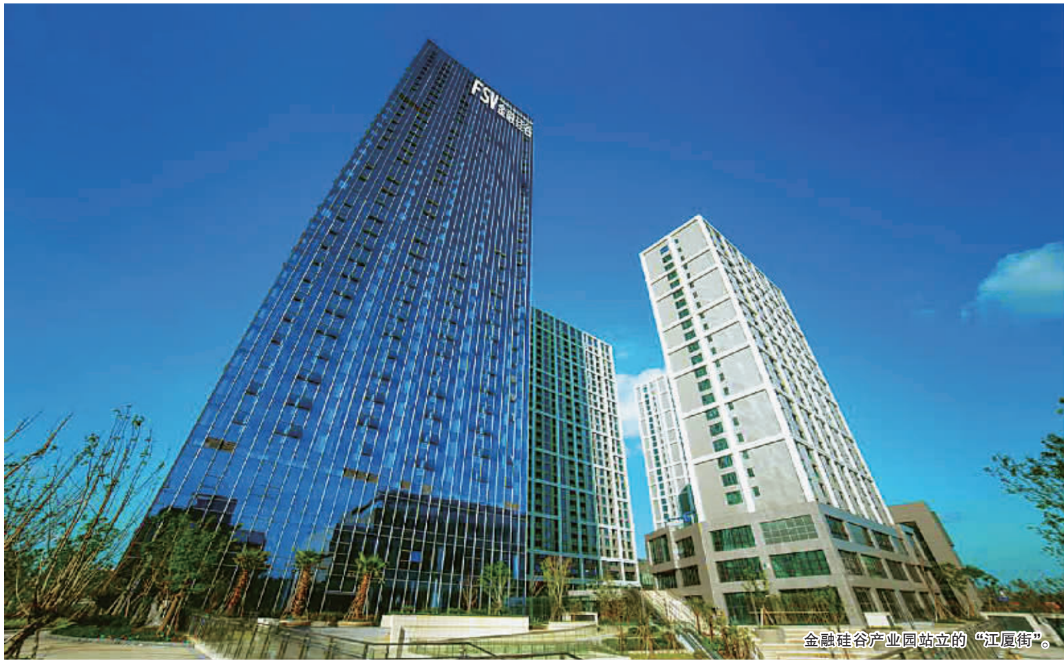
金融硅谷产业园站立的“江夏街”。

金融硅谷产业园启动运营短短7个月，吸引了清科集团华东总部、众筹家、蜂巢等平台公司及多家基金、证券、保险领域的资本大佬入驻。