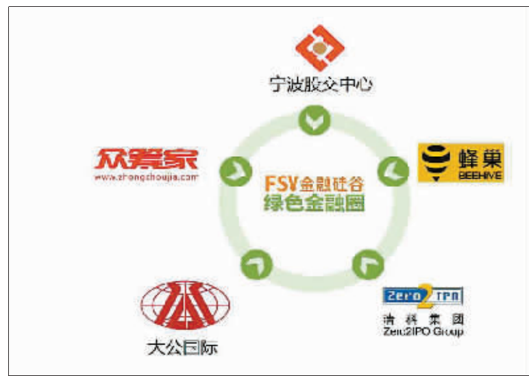
四大平台集聚金融硅谷产业园。