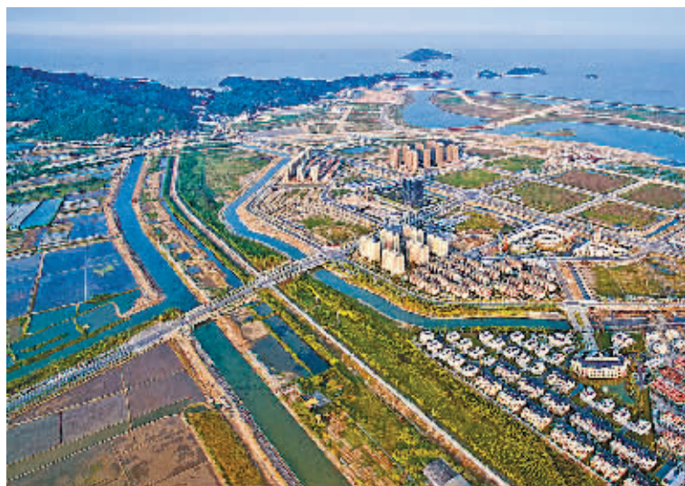
建设中的大目湾新城

五年形象： 象山影视城成为省现代服务业集聚示范区和市级特色小镇，大目湾新城框架基本形成，象保合作区宁波航天智慧科技城启动建设，环象山港公路建成通车，三门湾大桥及接线工程动工建设。主城区城市功能品质不断提升，涌金广场、国际风情街、汽车广场等一批综合体集聚效应显现。美丽集镇建设4个试点镇扎实启动。“一户多宅”清理为主的村庄梳理式改造全省推广，美丽乡村建设全省领先。