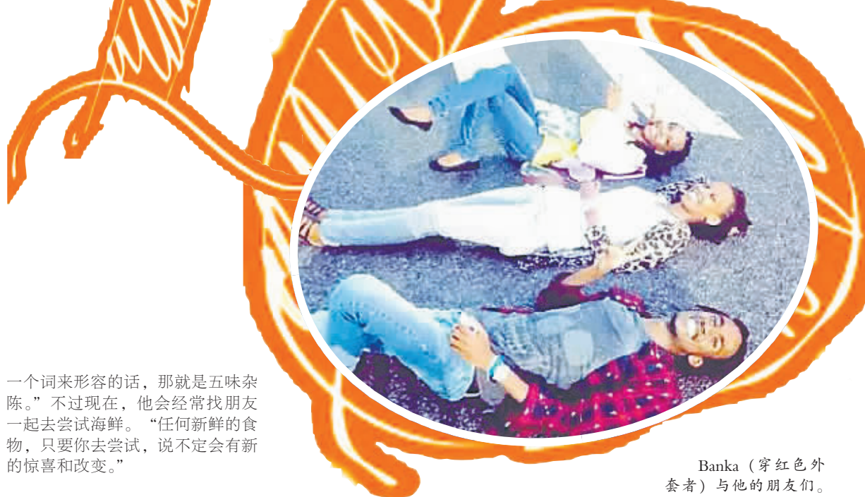
Banka (穿红色外套者)与他的朋友们。

丽。”他告诉记者,中式婚礼和印度婚礼有很多相似的地方,“比如新娘都会穿戴金戴银,婚礼的规模都很庞大。在印度,规模较小的一场婚礼也至少需要邀请亲朋好友500人一起来庆祝。”