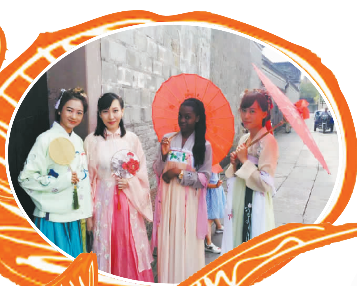
在慈城,老外妹子们入乡随俗穿起了汉服。(金晶 摄)

谈起难忘的经历时,他说自己曾多次参加宁波当地人的婚礼。“能看到不同于家乡的婚俗习惯,我觉得很有趣,很多中式传统,从服装、配饰到拜堂仪式等非常美