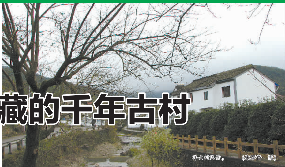
群山村风景。