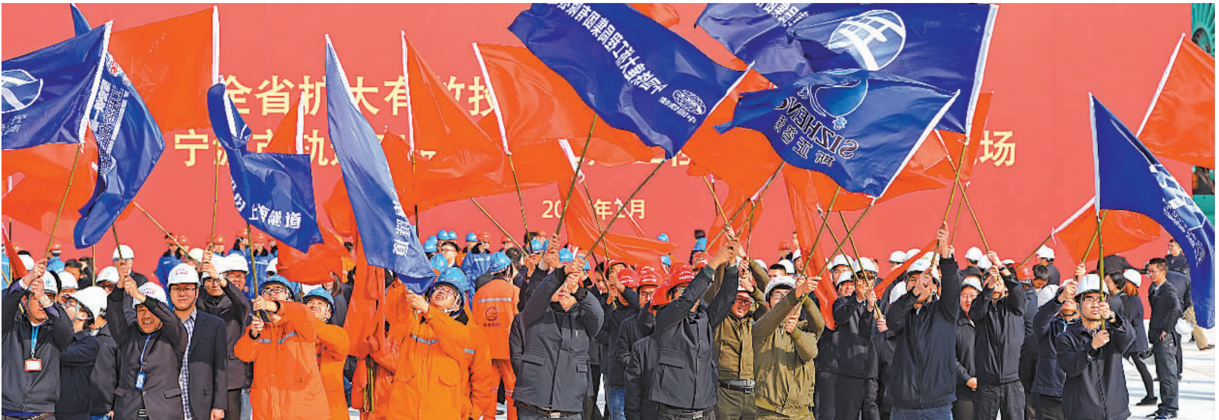
省市扩大有效投资重大项目集中开工仪式宁波现场。