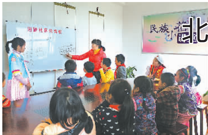
社区开设了“民族小花讲堂”,促进少数民族未成年人的身心健康发展。