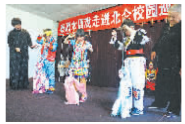
少数民族孩子正在认真学习木偶戏。

“不少少数民族未成年人的父母大多在区域内的企业就业,平时与孩子的沟通交流不多。为了让孩子们实地感受父母的工作环境,认识到父母工作的辛苦,我们还在企业建立了孝德教育基地,组织少数