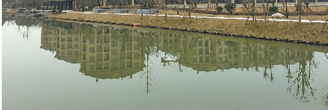
新建的岳童新村。

“集士港镇在强势推进城市建设步伐的同时,统筹推进新村建设,将在2020年内对卫星城市核心区范围内的村庄全面建成高品质高层住宅小区;对控规以外的村庄分步推进,建成各具特色的安居宜居美居新村,让城镇居民共享幸福新家园。”集士港相关负责人告诉记者。