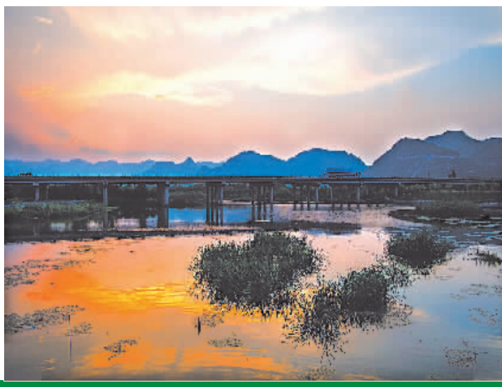
萧王庙镇的剡溪江流域。

与此同时,在去年完成了石柱岙、胡夹岙两座水库的除险加固后,奉化12座山塘全面开工建设,状元岙、王相公、苦竹亮等3座水库均已完成招投标,近期将陆续开工。