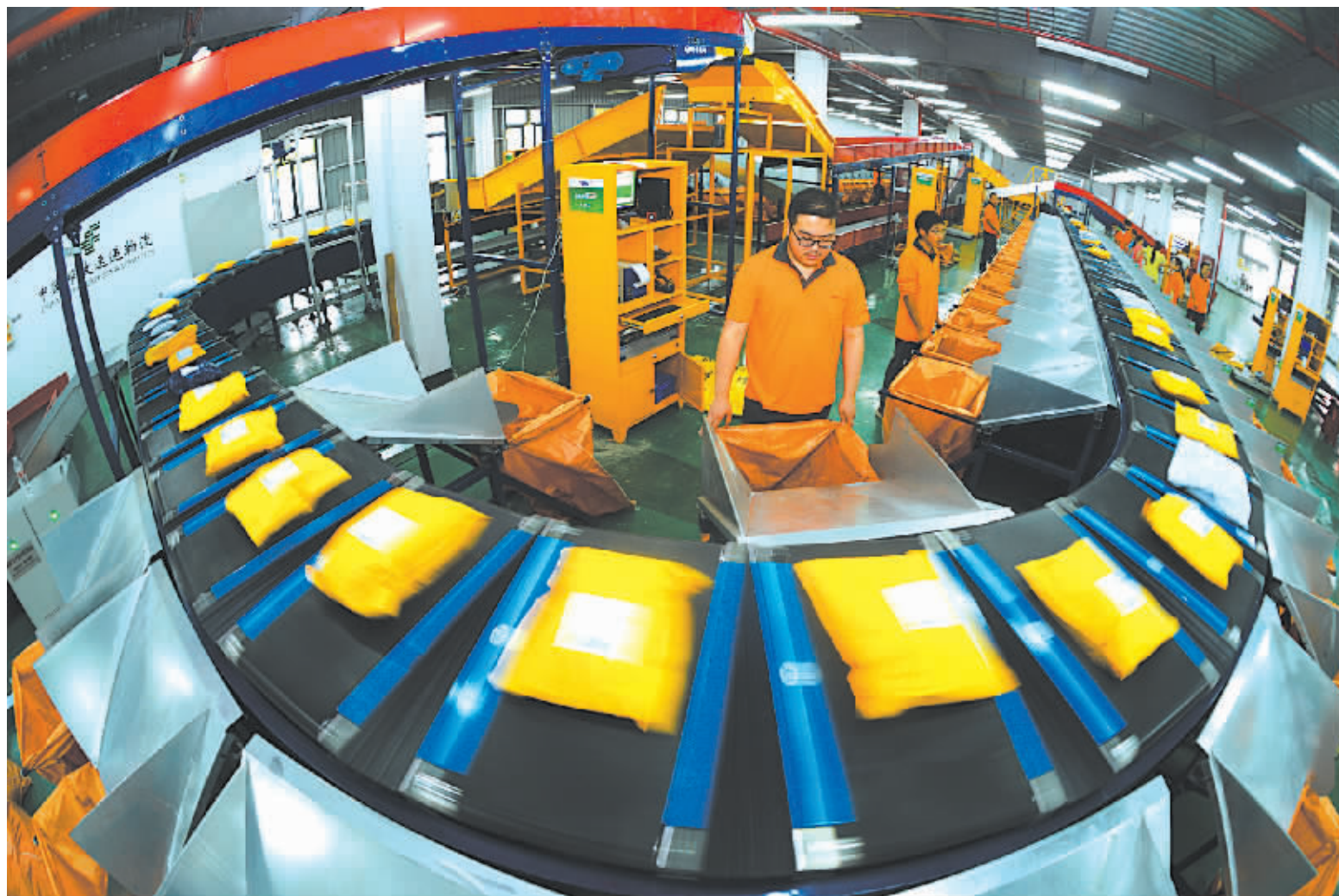
宁波国际邮件互换局工作人员在分拣邮件