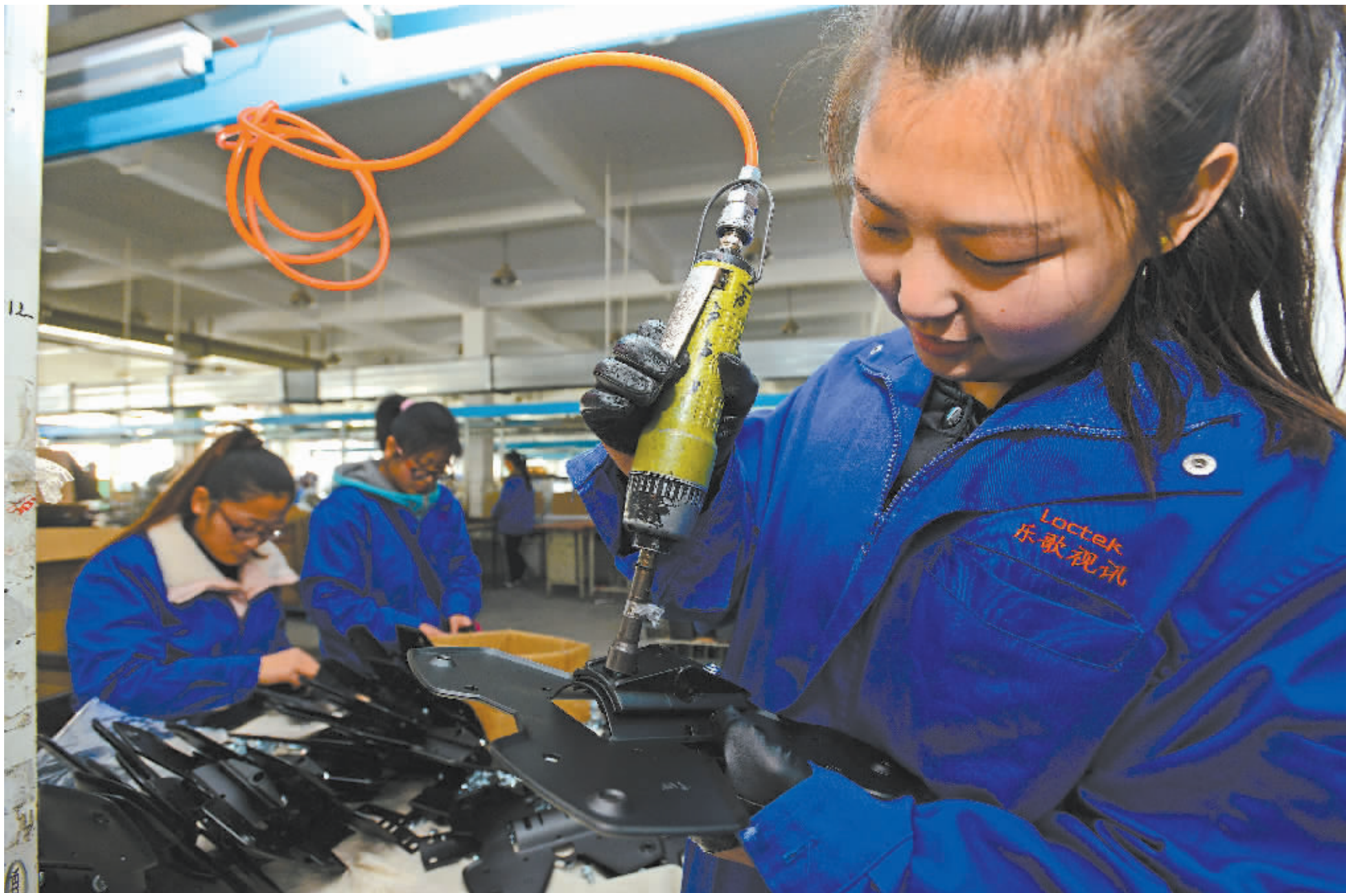
工人起制产品。

培育创新创业“新四军”。重点培育科技人员、海外留学归国者、民营企业家以及“企二代”创业者、青年大学生为代表的“新四军”投身创新创业。支持科技人才创业，通过“人才+项目”等支持模式，扶持一批拥有核心技术或自主知识产权的科技人才创办科技型企