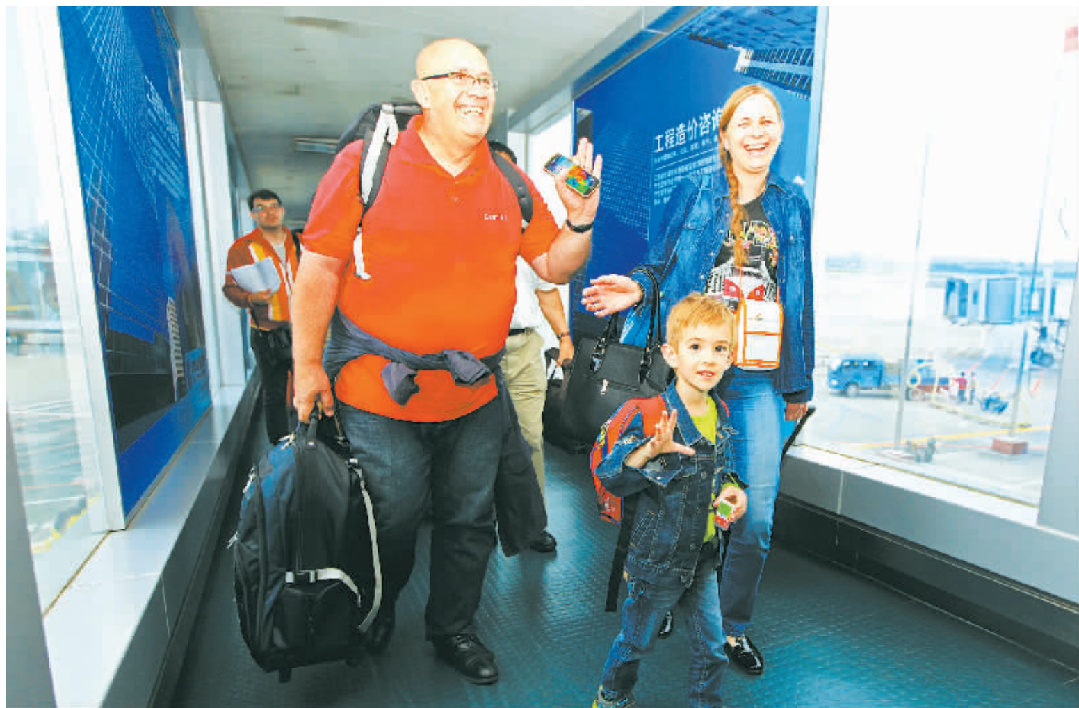
宁波至布达佩斯航班首航