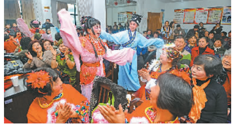
前天下午，在鄞州区长丰社区活动室，一出精彩的越剧《追鱼观灯》在居民身边上演，赢得阵阵喝彩声。当天，该社区举行“彩凤欢啼盛世春”——长丰社区春节文艺汇演活动，让居民提前感受新春喜庆氛围。

赛，但更多时候的表现差强人意。在第八轮主场击败山东女篮之后，马跃南就曾表示，虽然赢了球，但八一广博存在的问题并没有解决，尤其是多场比赛都是开局落后了才开始追赶比分。 在常规赛第一阶段双循环赛中，八一广博的战绩是6胜5负，她们不得不进行附加赛。在附加赛第二场主场与北京女篮的比赛中以56:81惨败之后，马跃南在赛后难掩失望之情。他认为那是一场丑陋的比赛，队员的表现很差，需要从作风上找原因。他表示，重新塑造一支队伍不容易，需要大家一起努力，因此他把队长露雯带到了赛后新闻发布会现场。 那场比赛露雯仅得到4分，她在发布会上表示，球队出现了一些问题，作为队长她应该承担责任。她还表态说，自己首先要做好，把队伍带起来，要打出拼搏作风和场上的气势。 在第二阶段的比赛中，八一广博的表现有了一些起色，一度取得了五连胜，她们最终在第二阶段的比赛中获得了B组第一名。渐入佳境的八一广博原本应该在第三阶段的比赛中有更加出色的表现，然而，队长露雯的意外受伤让八一广博的实力打了折扣。打完第20轮与新疆女篮的比赛之后，露雯便一直因伤缺阵。常规赛的最后一轮比赛，八一广博的另一名国手赵志芳也因为膝盖有伤无法上场，这让球队更是雪上加霜。 常规赛最后一轮，面对缺兵少将的新疆女篮，八一广博士气全无，大比分输给对手。马跃南认为队员的作风出了很大的问题，他表示要在今后的训练和管理中加强对队员的教育，同时要加强对训练，弥补基本功上的不足。 从常规赛结束到季后赛开始有20余天的时间，许多球迷表示：期待八一广博通过这段时间的休整，在各方面都能有所提高，在季后赛中能打出应有的水准。