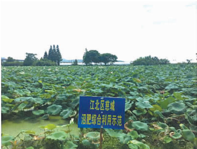
位于江北慈城的一处藕田消纳地。