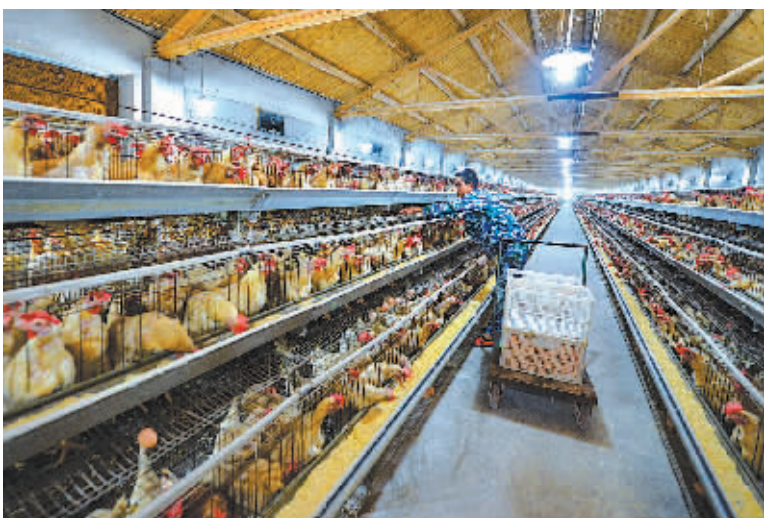
规模化养殖的慈溪新浦益大养鸡场。