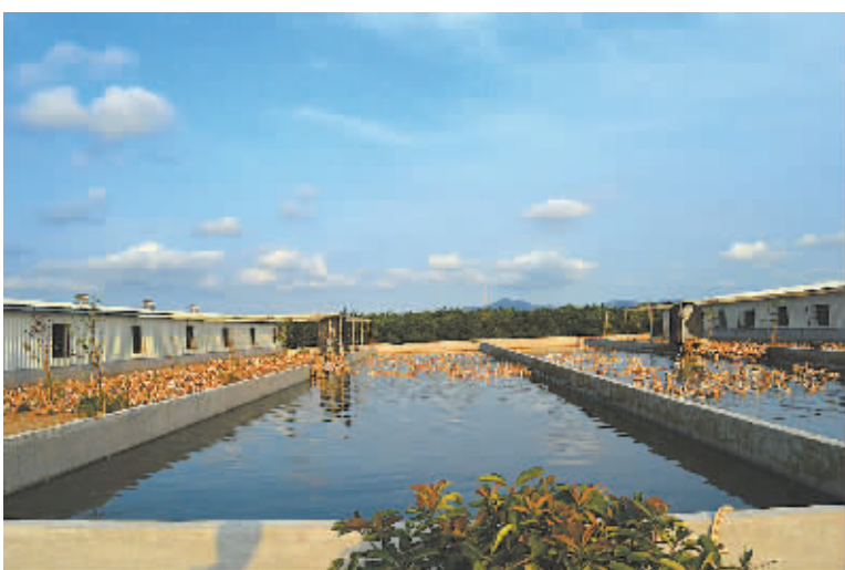
高岸养鸭保护水资源。

长期以来，污染整治难达标，污水排放不规范，把畜禽养殖场一次次地推上舆论的“风口浪尖”。面对不断提出的环保呼声，一大批处于禁养区范围和不能达标排放的“低小散乱差”养殖场首当其冲，被勒令关停。市农业局提供的数据显示，截至2016年底，全市累计关停、搬迁养殖场户4625家，2600家养殖场户完成治理、改造，落实生态消纳地92万亩，投入资金7.7亿元，调减生猪存栏近50万头。我市还健全监管体系，基本建成以“一场一人”为核心的县、镇（乡）、村三级畜禽养殖污染网格化防控巡查网络；奉化、余姚、慈溪、宁海4个生猪重点区县（市）构建了线上智能化防控网络平台。