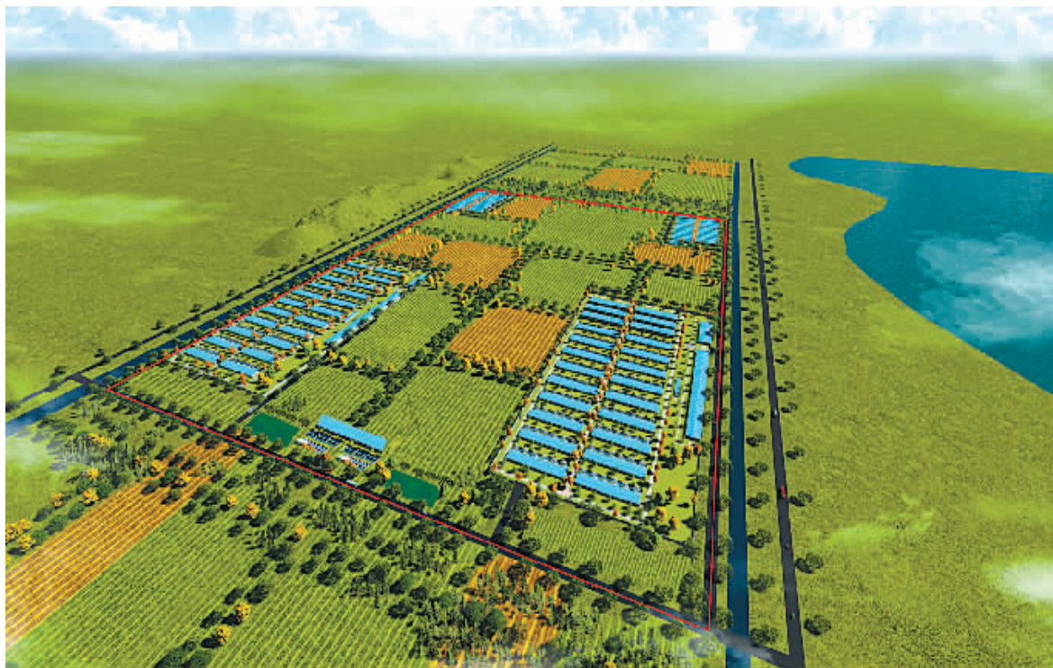
规划建设中的象山道人山牧场效果图。