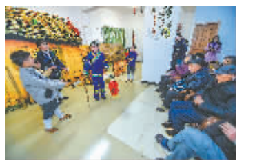
1月19日,孩子们在给老人们表演传统潮剧。当日,浙江省湖州市吴兴区环渚街道南太湖养老服务中心的老人们观看了一场热闹的“小戏班”迎春演出。环渚街道塘南小学的潮剧非遗传承人小演员们在老师的带领组织下,表演了精彩的潮剧,并为老人们写“福”送“福”字,让老人们在欢乐的气氛中迎接新春佳节的到来。(新华社发)