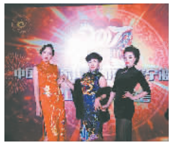
昨日,中国摄影家协会函授学院宁波分院举行学院成立五周年文艺汇演,5年来学员们共有7人加入了中国摄协,20余位师生的百余幅摄影作品先后在国际国内摄影大赛中获奖。图为表演现场。

闻果立是中国陶瓷设计艺术大师、文化部艺术发展中心特聘鉴定专家、中国陶器学会会员、浙江中立古陶博物馆馆长闻长庆之子,他与其父一起研究探索越窑青瓷奥秘多年,成功烧制古代失传千年贡御皇家用越窑秘色瓷,恢复越窑秘色瓷烧制工艺方法,获国家发明专利;闻人越窑秘色瓷作品被国内及世界多国博物馆收藏、展出,G20峰会也选了三件闻人越窑秘色瓷作品作为贵宾厅陈设。