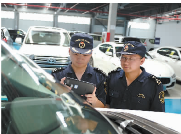
宁波海关运用移动单兵查验设备对宁波梅山口岸首批平行进口汽车实施监管