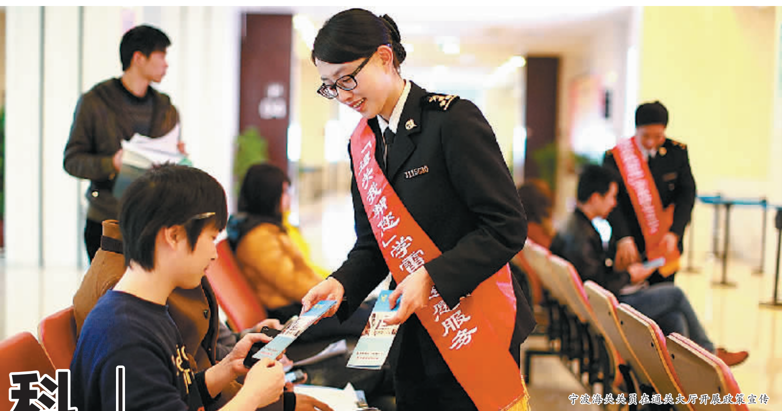
宁波海关关员在通关大厅开展政策宣传

2016年,宁波海关加大科技投入,开创智能查验新时代,助企通关效率再提速;推行汇总征税、保税监管、工单式核销等多项惠企服务,把政策利好实实在在交到企业手中;启动全国通关一体化通关模式,有效促进贸易便利化,支持国家“一带一路”建设;培育新兴业态,助力宁波成为口岸日益完备的开放型经济大市。