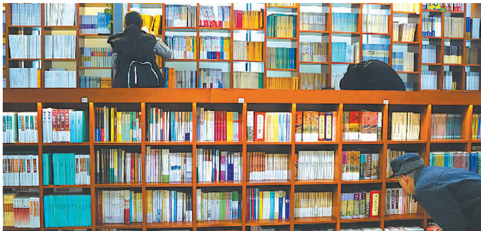
读者在宁波书城选购书籍。