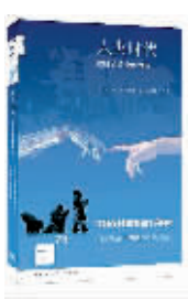
生活读书新知三联书店 【美】黛安娜·阿克曼 著 《人类时代——被我们改变的世界》 2017 i