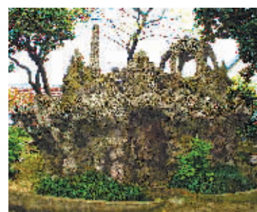
图为焕然一新“新”的假山。

该假山位于镇海区蛟川街道俞范村,建于1935年,占地面积109平方米,高4.5米,长度东西向约6.9米、南北向约5.5米,山体筑有山洞。假山形象逼真:岭中“禽兽”出没、山吞“树木”林立、悬崖“藤枝缠绕”“瓜果蔓延”……2011年被列为镇海区文保点。因年久失修,该假山部分构筑物堆垒小品风化损坏,故镇海区去年11月起对该假山实施“修