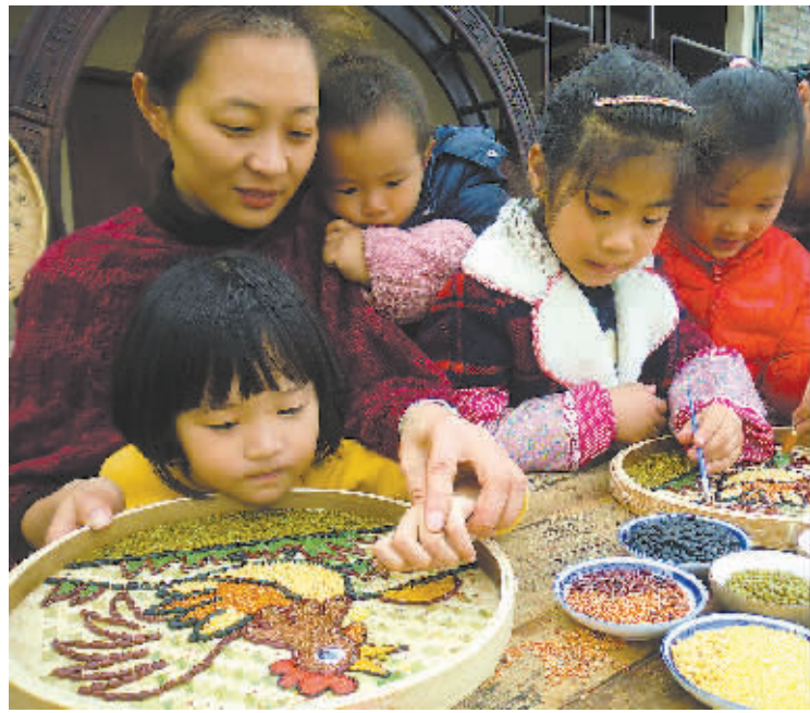
图为孩子们正在“五谷画鸡”。

本报讯(记者南华 通讯员沈松虎)鄞州区两博物馆在鸡年来临之际推出与“鸡”有关的活动。