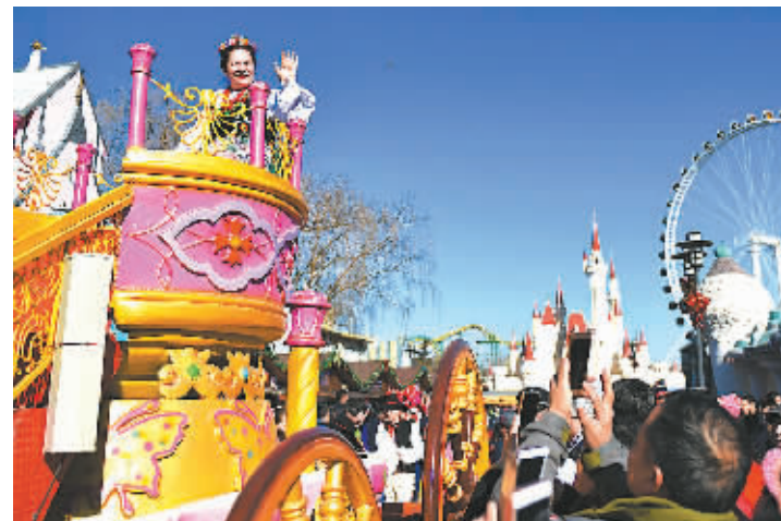
2月1日,市民和游客在北京石景山“洋庙会”上游玩。当日是大年初五,北京天气晴好,众多市民和游客来到北京石景山“洋庙会”游玩,体验“中国春节”世界味道,感受带有洋味儿的节日氛围。