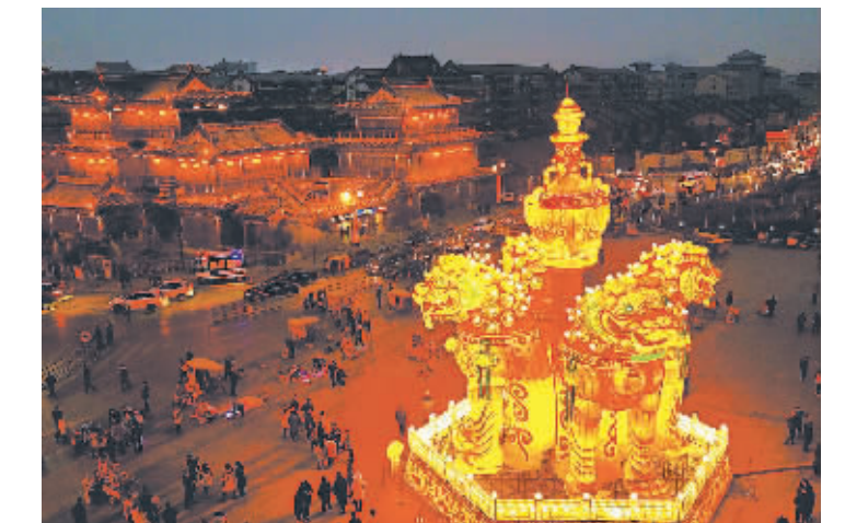
这是开封龙亭公园门口的一座大型主题花灯(1月31日摄)。今年的灯会以“灯红古都、福融开封”为主题,造型多变、色彩缤纷的80余组大型主题造型花灯,吸引了来自全国各地的游客前往赏灯、观景。