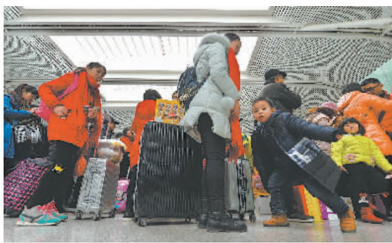
2月1日,旅客在南昌火车站排队候车。

新华社北京2月1日电(记者齐中熙)春节假期第六天,各地迎来旅游、探亲、务工的返程客流高峰。 经国家旅游局数据中心综合测算,2月1日全国旅游接待总人数2740万人次,同比增长14.1%;实现旅游收入340亿元,同比增长14.8%。北京、上海、广州、深圳、成都等城市成为回程热门目的地。 铁路方面,多地铁路局增开