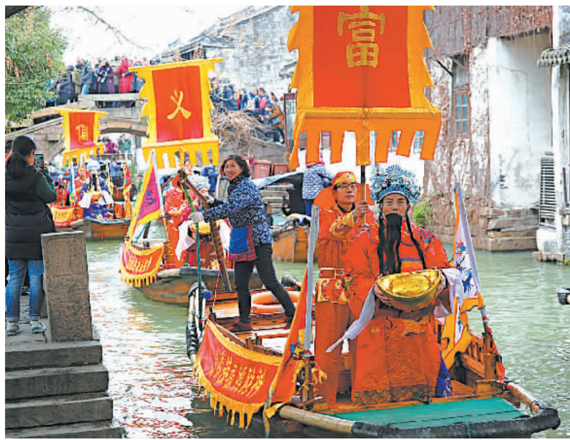
2月1日,在江苏苏州周庄古镇,“财神”给游客送福。当日是农历正月初五,我国民间有“迎财神”的习俗,多地举行特色民俗活动,祈福贺新春。