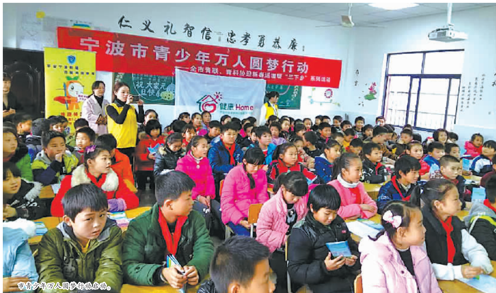
市青少年万人圆梦行动启动。