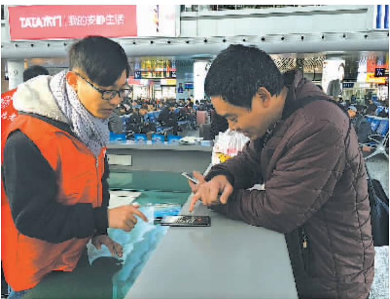
春运志愿者为回乡客提供乘车信息服务。

宁波市青少年万人圆梦行动将持续到2月底，期盼更多的爱心加入其中，市民可关注“青春宁波”官方微信了解详情，或拨打89186690咨询。相信更多的爱心一定可以穿越寒冬，带来春天般的温暖。