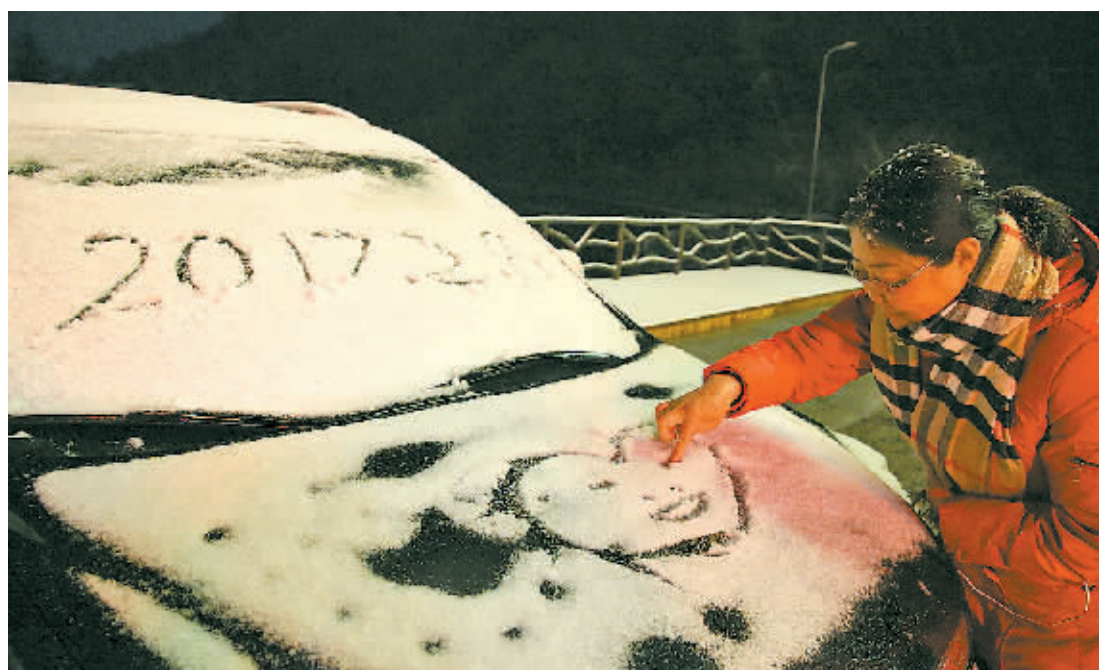
昨晚,在四明山一度假山庄,一位游客在汽车的积雪上写字。