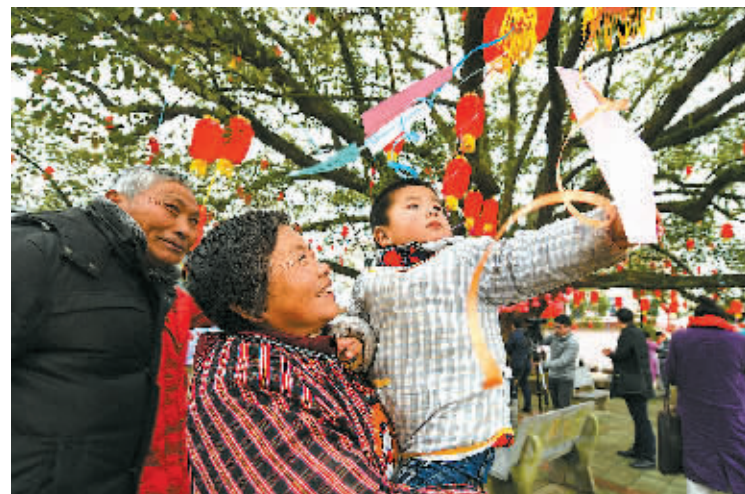
昨天下午,宁海县岔路镇纪委在下岞村500多年的老樟树下,举办别具一格的元宵廉政灯谜会。400多只红灯笼下悬挂的灯谜,吸引了不少周边村民驻足观看。