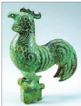
三星堆遗址出土的青铜鸡。 (资料图)

早在先秦时期，鸡就以其形象和特点赢得世人尊重，成为有德之禽。《尔雅翼》《韩诗外传》都赞美鸡有文、武、勇、仁、信五种美好的品德。雄鸡头戴高高的、火红的鸡冠，给人文质彬彬的感觉，是为文德；鸡脚后面有突出的足趾，是天生的进攻武器，是为武德；在强敌面前，鸡敢于一拼，是为勇敢；鸡找到食物后不独自占有，会呼唤同伴一同啄食，母鸡对子女更是关爱有加，是为仁爱；雄鸡每天准时报晓，极大地方便了人们的