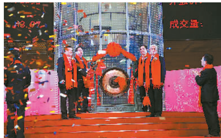
镇海股份鸣锣上市。

本报讯(记者杨绪忠)昨天上午,镇海股份在上海证券交易所主板成功上市,从而使我市A股上市公司达到60家。