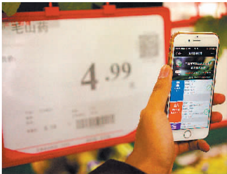
只需轻点指尖,就能获取肉菜的详细信息。

在政府部门的推动下,两家试点企业迈出了追溯第一步。M6生鲜、宁波豆制品有限公司、宁波五龙潭蔬菜食品有限公司等大中型企业也被纳入推广计划,有望成为下一批肉菜追溯系统建设试点单位。“未来,肉菜