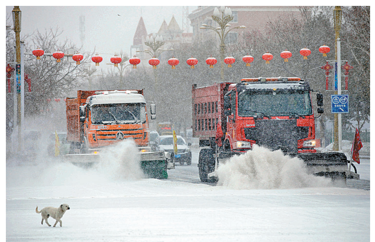
2月19日,在新疆阿勒泰地区布尔津县城,清雪车在清扫路面积雪。当日18时,中央气象台发布寒潮蓝色预警:受强冷空气影响,19日夜间至21日,新疆、西北地区东部、华北中南部、东北地区东南部、江淮、江汉、江南北部等地气温将下降8摄氏度以上,部分地区超过12摄氏度。