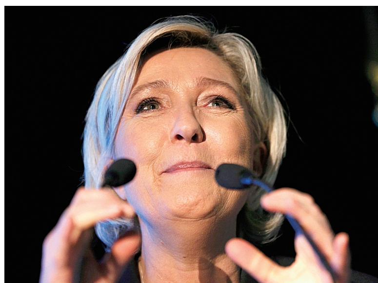
在法国克莱沃-莱拉克,法国极右翼政党“国民阵线”领导人玛丽娜·勒庞参加活动时发表讲话。

法国民调机构Ifop23日公布的最新民调结果显示,在定于4月下旬举行的总统选举首轮投票中,勒庞预计可获得26.5%的选票,支持率稳居第一;紧随其后的马克龙和菲永则预计分别获得22.5%和20.5%的选票。 Ifop分析认为,贝鲁的弃选虽然使他的部分支持者流向菲永,将菲永的民意支持率推高了1.5个百分点,但他和马克龙结盟让马克龙的支持率提高了3.5个百分点,这成为马克龙在最新民调中领先菲永的主要原因。马克龙自己也将与贝鲁的结盟称为“选战的转折点”。