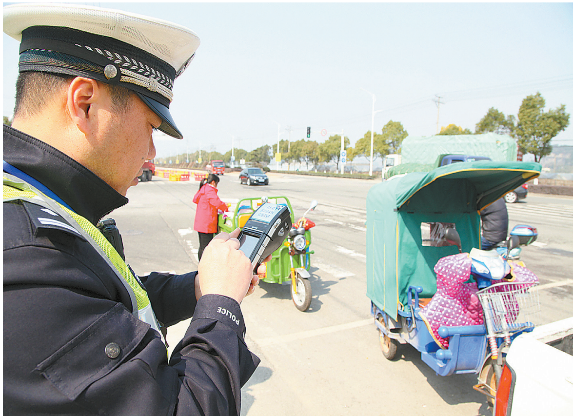
交警正在用警务通录入被扣“电三轮”相关信息。