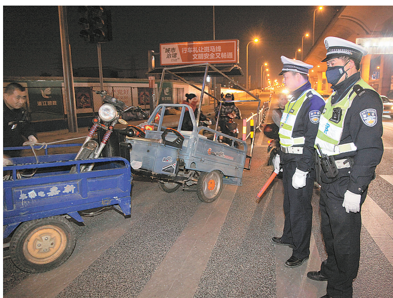
交警正在夜查“三轮车”。

“这次对‘三轮车’的整治，是近年来最为严厉的一次。”有交警告诉记者，根据“大数据”系统分析，“电三轮”肇事后果很严重，伴随而来的往往是伤残或死亡。以鄞州为例，去年1月至今年2月，共发生涉及电动三轮车、正三轮摩托车的重大交通事故10起，死亡10人。而从交通事故造成的损害