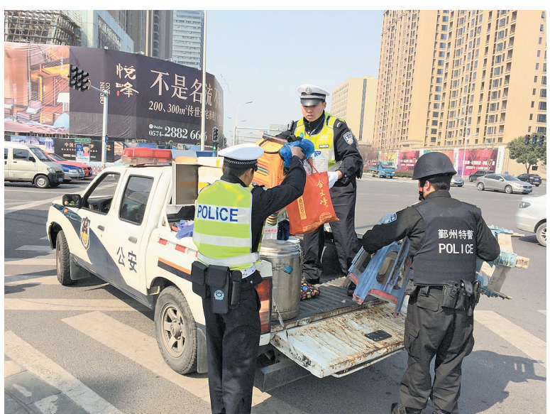
两辆载有快餐的无牌正三轮摩托车被交警拦下并暂扣后，交警帮车主运送快餐到某工地。