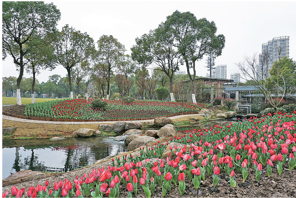
图为日湖公园郁金香盛开情景。

红叶李也是春季最佳的观花观叶树种。叶片全年呈紫红色,花虽小巧繁盛,淡粉红色,花瓣很薄,