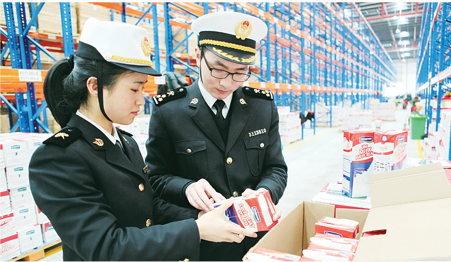
梅山跨境商品仓库内，宁波海关关员在仔细核对商品的信息。