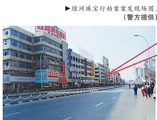
绿洲珠宝行劫案案发现场图。