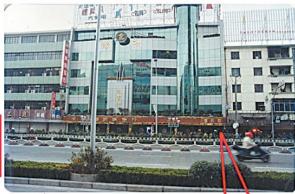
绿洲珠宝行中心位置