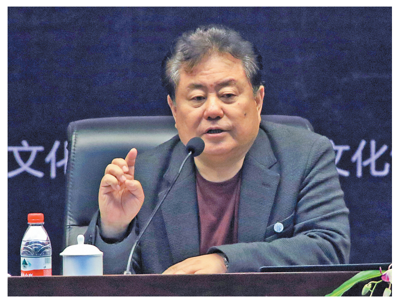
徐沛东作《歌曲创作的回顾与思考》专题讲座。

本报讯(记者陈青)“我有5年没到宁波了,变化非常大,宁波是个很有魅力的地方,让人流连忘返。”中国音协副主席、著名作曲家徐沛东昨日上午在江北文化中心小剧场作了《歌曲创作的回顾与思考》专题讲座,宁波的音乐工作者、词曲作者、喜爱徐沛东作品的爱好者,以及参加省音协“绿水青山·金山银山”音乐作品创作研讨会