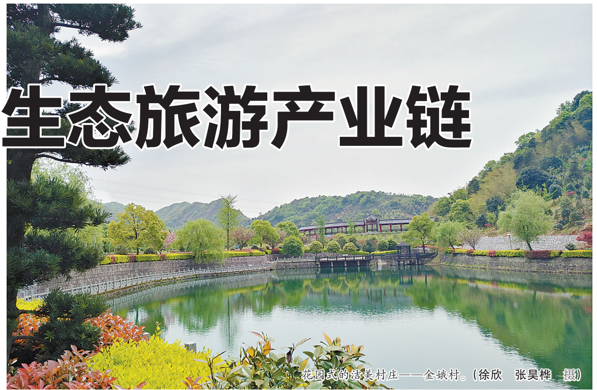
花园式的精美村庄——金峨村。

据悉,这台价值20余万元的机器,可以利用真菌发酵的方式,将厨余垃圾转化为有机肥,理论上每天可处理垃圾1吨,所以处理村中每天回收的200公斤左右厨余垃圾,完全富余。