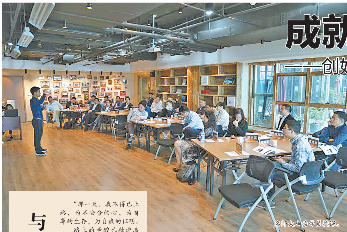
名师大咖为学员授课。