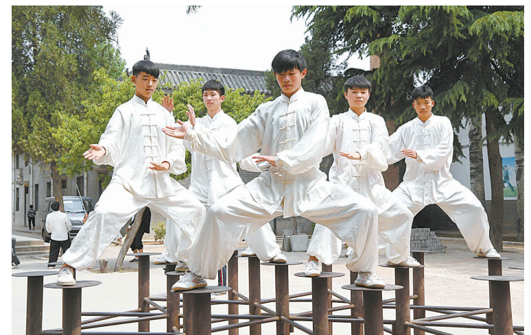
在河南省温县陈家沟,学员在武馆习练太极拳。

在太极拳发源地河南省温县陈家沟,每年有近万名国内外太极拳爱好者前来寻根学艺,并将太极拳和太极文化传播到世界各地。