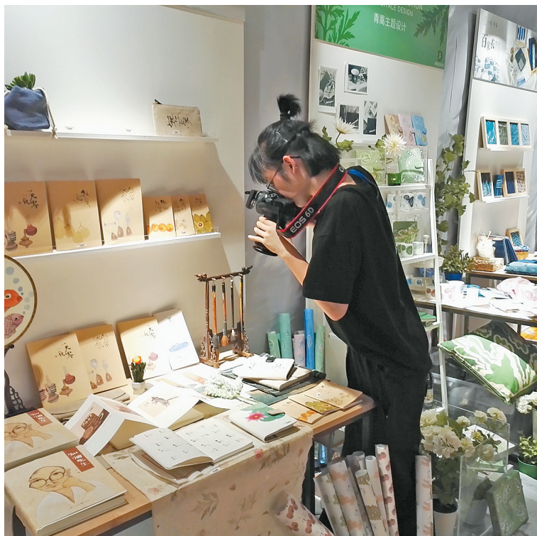
时尚文具引人关注。

从2005年开始，宁波就是“中国文具之都”。“十三五”期间，宁波文具年销售额将达到