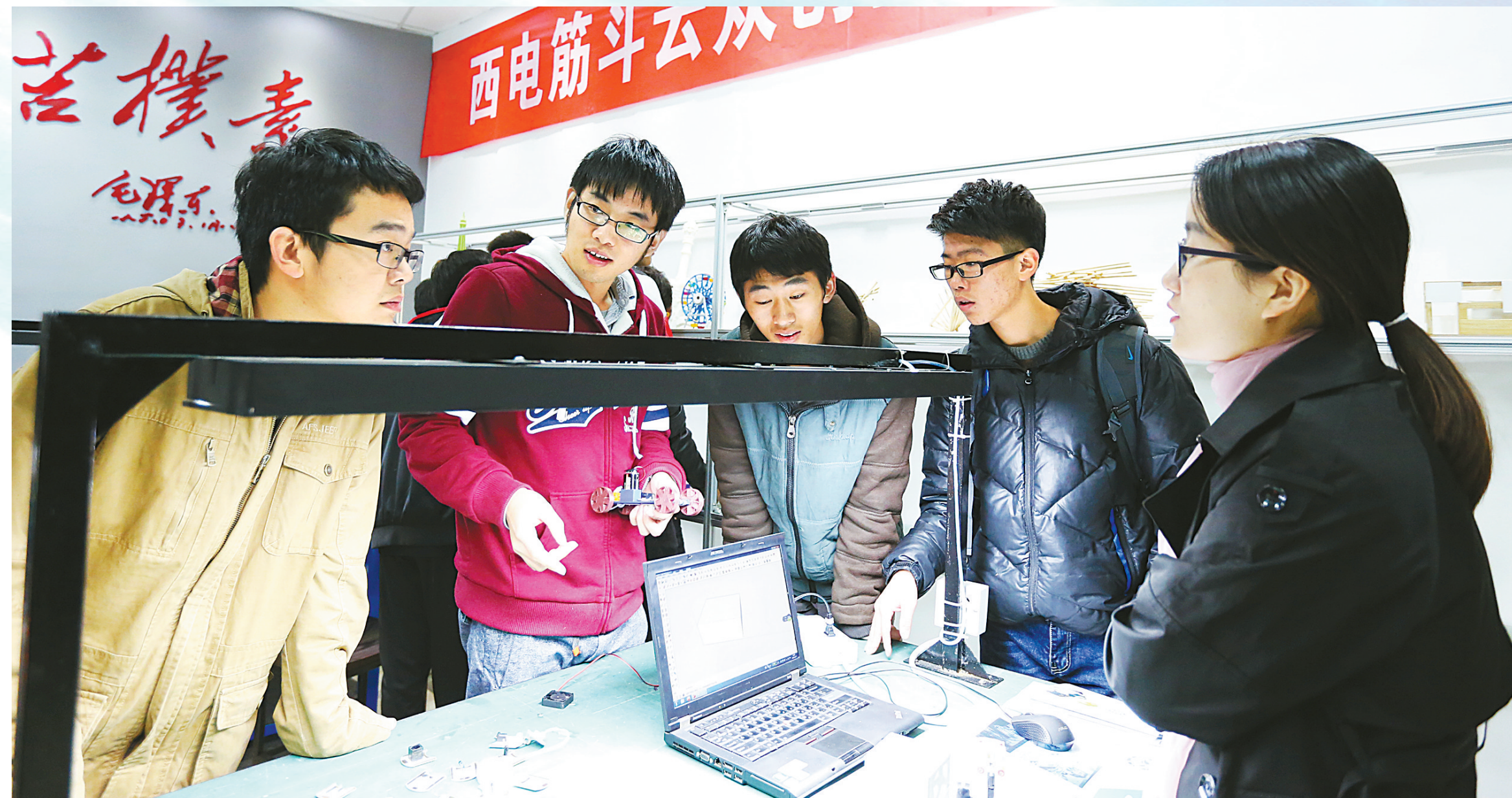
西电筋斗云众创空间举行开放日活动