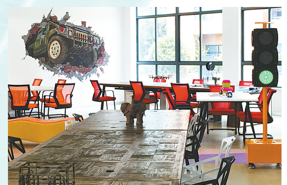
宁波国家大学科技园珍珠众创空间

要认真贯彻落实市第十三次党代会和市委推进会议精神，敢闯敢试、担当实干、奋发有为，坚定不移扛起宁波使命，坚定不移做强宁波制造，全力推进“中国制造2025”试点示范城市建设真正落地结果。 ——宁波市委副书记、市长 裘东耀