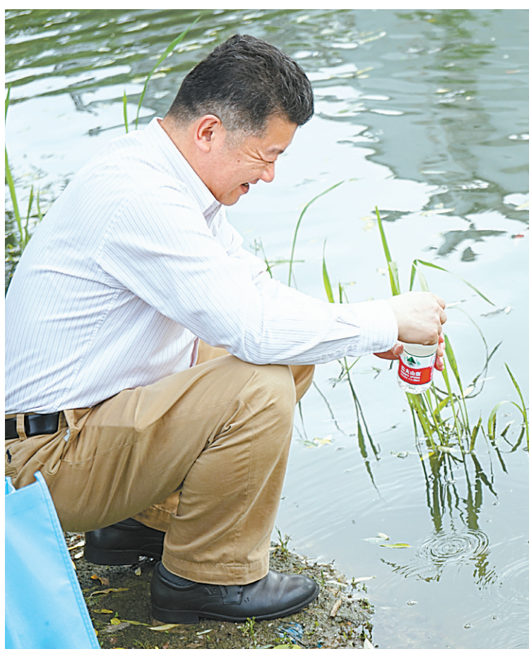
政协委员在余姚石婆桥江取水采样。

最大的困难也怕坚持，最大的问题也怕团结。经过三年持续作战，“五水共治”民主监督已经成为政协工作的一个响亮品牌。站在现有基础上，只要拿出愚公移山的勇气，形成众志成城的合力，在监督中加油干，在苦干中监督助推，那么这场“剿劣”战争的胜利者必定属于我们。