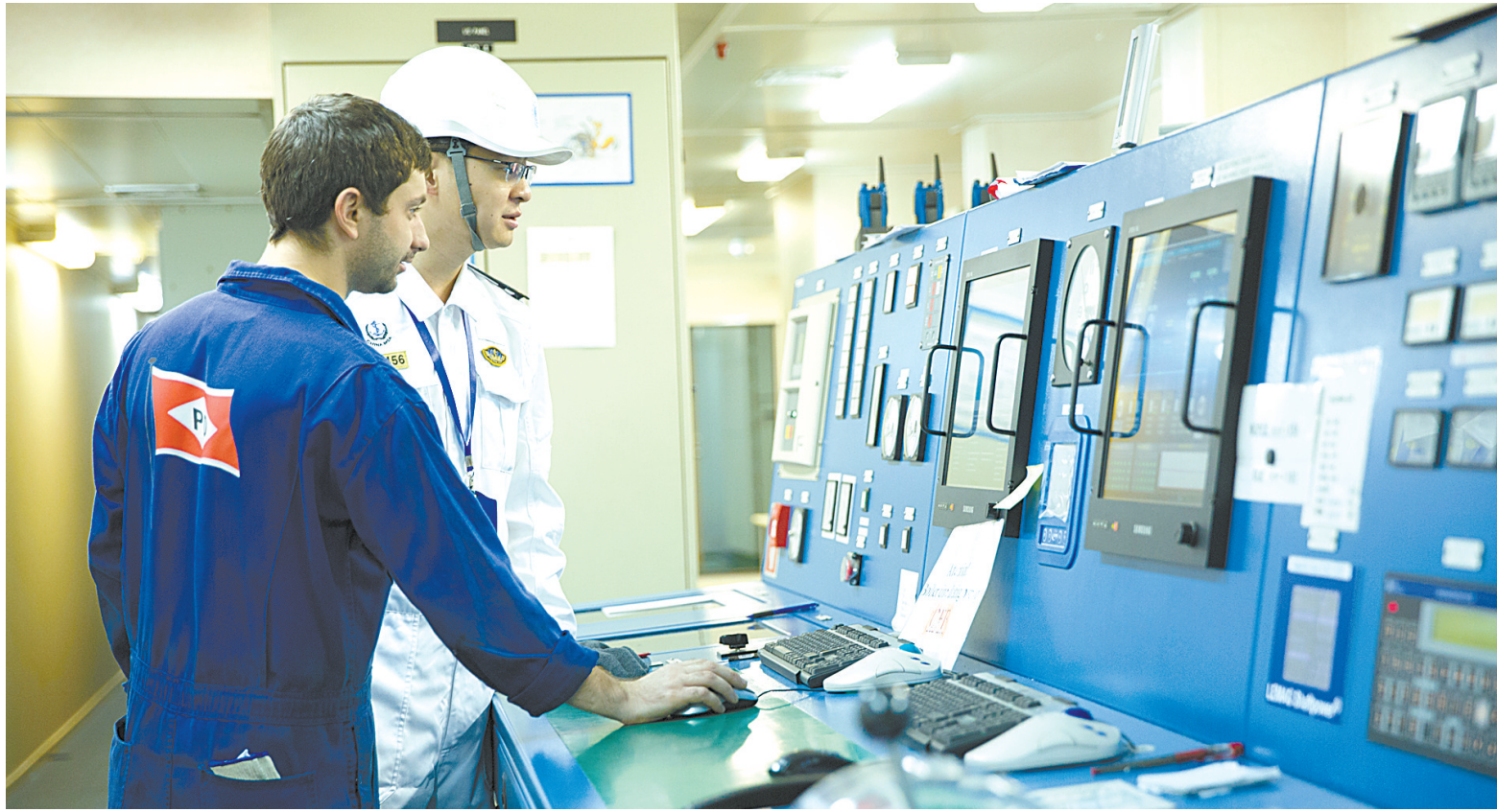
海事部门对到港外轮的机器设备进行检查。