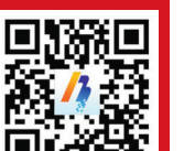
中国宁波网手机版