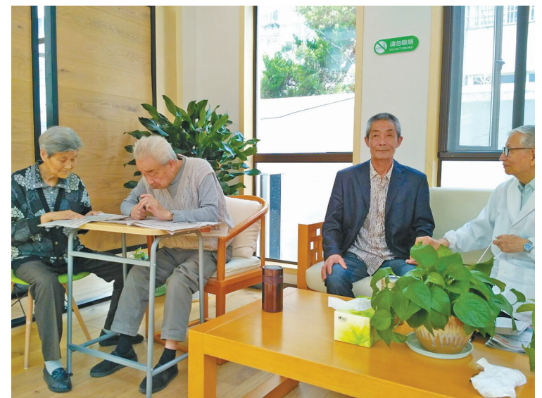
图为浙江嘉科智慧养老服务有限公司医护人员正在为住院的老人进行体检。

本报讯(记者林金康)近年来,随着全社会老龄化进程的加速,居家养老成了各地养老工作的一大难题。为彻底缓解这一难题,嘉兴市有关部门运用智慧养老服务,充分发挥市场化的运作机制,开发居家养老服务最后一公里。