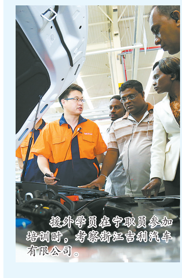
援外学员在宁职院参加培训时,考察浙江吉利汽车有限公司。

目前,宁职院正致力于办好援外培训项目、中外合作办学项目、吸引国际生前来留学,通过打造国际化高品质职教之路,服务“一带一路”建设。