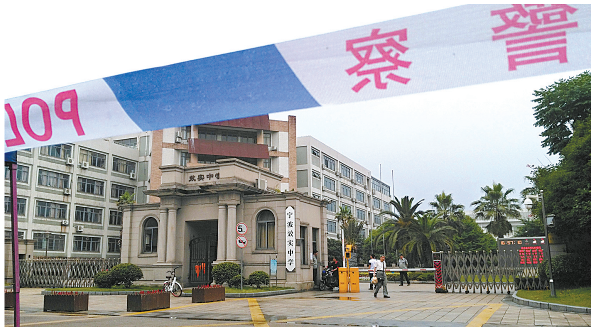
昨天下午,效实中学考场外已经拉好了警戒线。

具体考试时间为:普通高考6月7日9:00—11:30考语文、15:00—17:00考数学;6月8日15:00—17:00考外语。单独考试招生6月7日9:00—11:30考语文、15:00—17:00考数学。请考生把握时间,不要迟到。其中,外语因含听力考试,须在开考