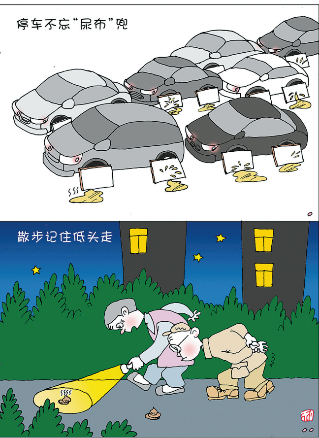
狗狗“教”人 王祖和 绘