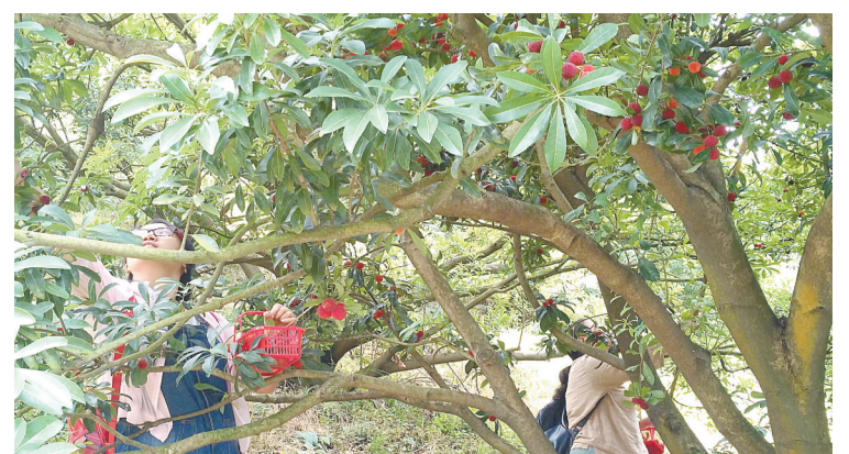
图为市民在绿野山庄杨梅园摘杨梅。

本报讯(记者徐欣 通讯员王忠良)又到杨梅采摘季。前日,江北绿野国际杨梅节在慈城绿野山庄景区开幕。随着景区万亩杨梅园首次对外开放,今年宁波近郊又多了一个杨梅采摘的好去处。