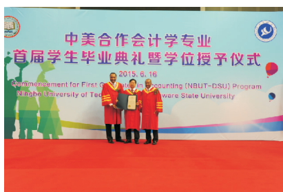
首届毕业典礼特拉华州州长贺信