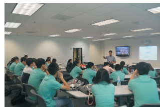
暑期赴美见习课堂学习