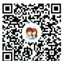
信息与计算科学(中美合作办学)专业招生咨询QQ群

学院招生热线：0574-87080388, 87611881、87615596、87615809