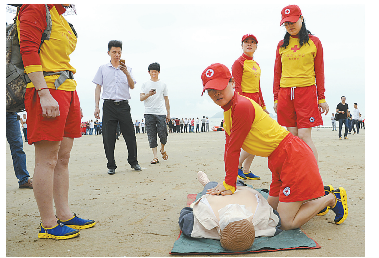
随着夏季的到来,滨海景区游客日渐增多。日前,为了防止溺水事故的发生,宁波市旅游局联合象山县政府在松兰山滨海度假区开展海上防溺水应急救援安全演练,提高专业救援人员和导游、旅游志愿者的涉水应急救援能力。

国际认证频繁翻新,给外贸大市宁波带来了一定的影响。在未取得认证证书的情况下,一些企业擅自冒用UL、VDE、CSA等国外知名认证标志,一旦被查,后果不堪设想。为此,宁波检验检疫局提醒企业,一方面要严格按照要求开展产品认证测试,以确保自身的产品更新迭代能力跟上认证步伐。另一方面,要谨慎加贴认证标志,以确保产品设计、生产和包装各方面更规范更安全。