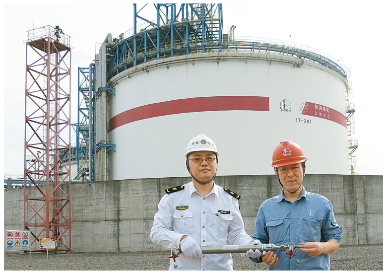
图为检验检疫部门工作人员进厂检验。

中石化镇海炼化分公司拥有国内规模最大、技术最先进的乙烯生产项目,2016年乙烯产量达112.6万吨。