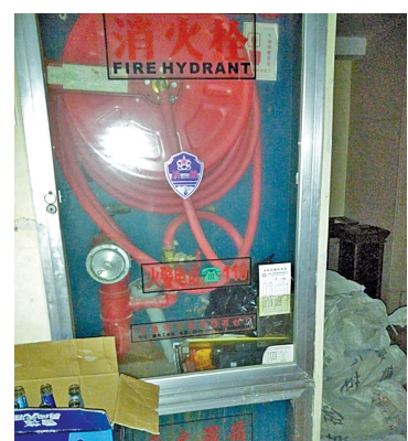
6楼消防栓箱内依然没有放置水带。

今年4月30日下午2时34分，网友“小瓦GG”向中国宁波网民生e点通爆料，江夏桥东金光中心凌江名庭着火了。现场浓烟滚滚，所幸无人伤亡。