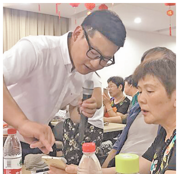
志愿者教授老人使用智能手机。