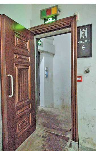
通往地下车库的安全通道口被按上了防盗门。

4月20日，网友拨打中国宁波网民生e点通热线81850000反映，北仑环球东方港城小区单元防烟室与楼梯间之间的防火门几乎百分之百地被拆换成了防盗门，为消防安全埋下严重隐患。