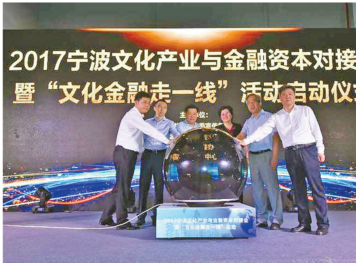
图为6月20日文化产业与金融资本对接会启动仪式。

更令业界振奋的是，这次对接会传出消息，我市的文化企业融资渠道将有更多选择，宁波股权交易中心即将推出“文创板”“金保贷”，宁波产权交易中心、文创小贷公司、云朵网正准备为文化企业打造新的融资平台。有关专家认为，受我省打造万亿级文化产业、我市打造千亿级文化产业等利好政策的刺激，金融资本正快马加鞭进军文化“蓝海”，掘金文创产业。