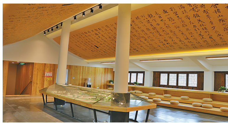
天一阁·月湖景区游客中心

天一阁·月湖5A级景区创建意义重大、影响深远，通过政府主导、部门联动、社会参与，不仅使广大市民多了一个旅游休闲的好去处，更在于宁波人乃至浙江人此后将会多一个可以为之执着守望的精神和文化家园，为“诗画浙江”的旅游品质提升树立标杆。