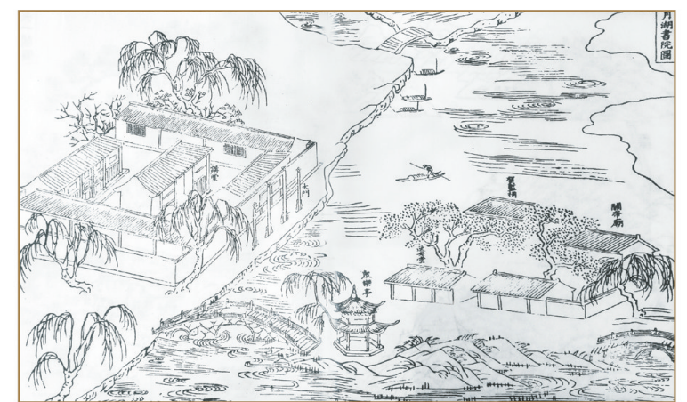
清·同治《鄞县志》之月湖书院图