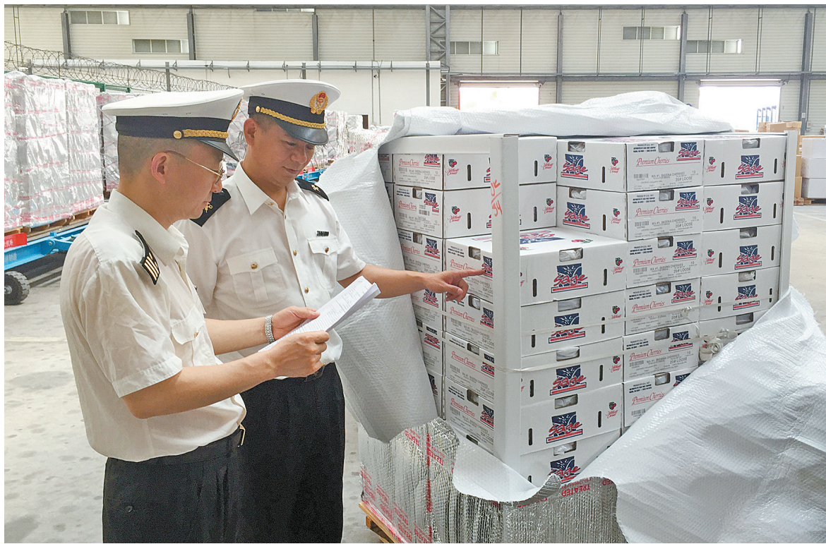
据介绍,这批车厘子在美国果园里采摘后从西雅图直飞宁波,整个运输过程为冷链物流,温度设在0至5摄氏度之间,为车厘子最大程度保鲜。图为海关关员仔细核对产品信息。

间、多环节的运输过程给水果保鲜带来很大困难,对鲜果通关时效提出了高要求。为完成包机保障任务,宁波栎社机场事先做好充足准备,货站分公司多次召开保障协调会,与航空公司、货主、联检单位多次确认相关细节。