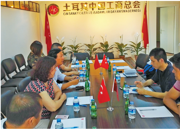
土耳其中国工商总会接受本报记者采访。