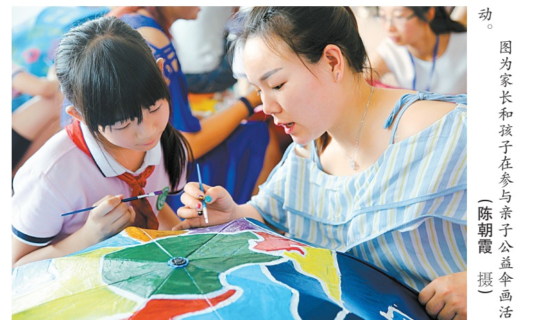
图为家长和孩子们在参与亲子公益伞画活动。

除了“鱼鹰”小分队,地处高桥镇的宁波大红鹰学院“开拓者”暑期实践团、万盛文创园青年油画家、博泽学校的小朋友们,纷纷加入到治水宣传的队伍中。7月2日,高桥镇“个性涂鸦 助力剿劣”亲子公益伞画活动在博泽学校开展,40名学生和家一起,在公益伞上描绘出一幅幅美丽的治水宣传画。