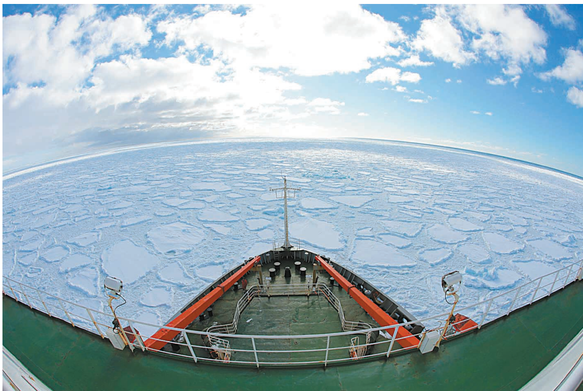
“雪龙”号科考船资料图片。