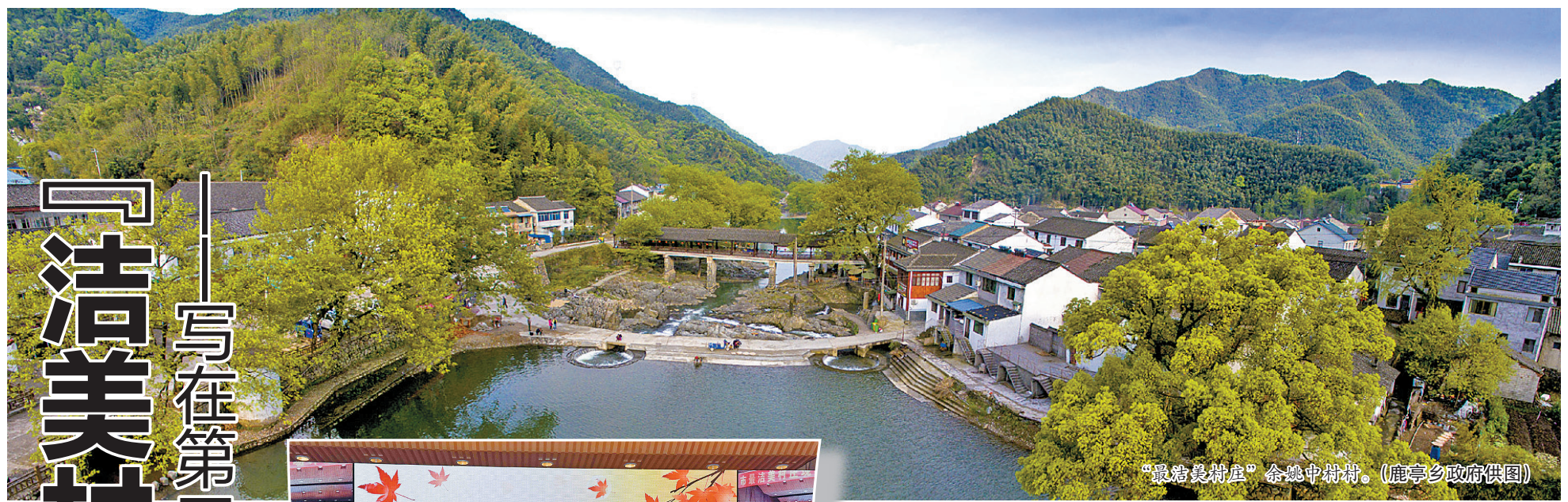
“最洁美村庄”余姚中村村。