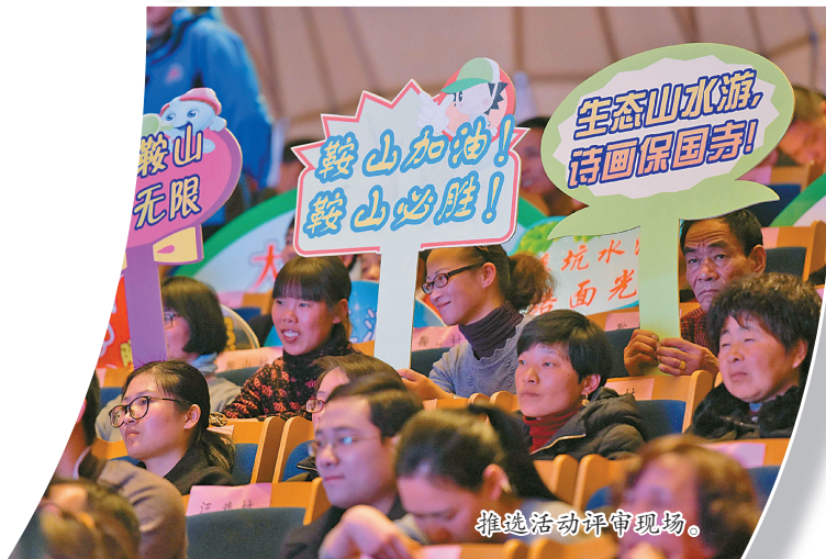
推选活动评审现场。