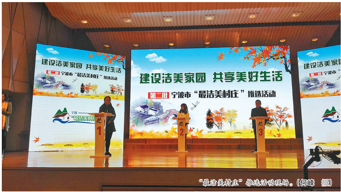
“最洁美村庄”推选活动现场。

爱家爱乡之情，犹如深埋在每个人心中的种子，经过“春雨”的滋润破土而出，茁壮成长。“最洁美村庄”推选活动，恰如这场润物细无声的及时“春雨”！